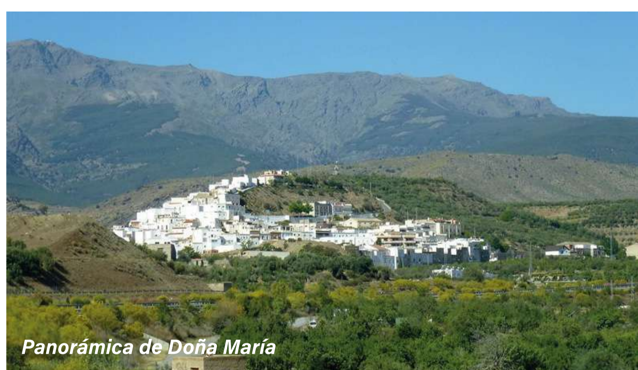
Panorámica de Doña María