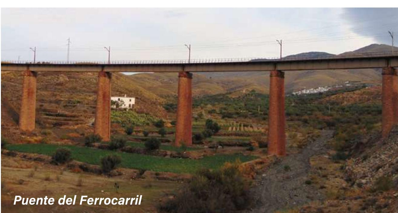
Puente del Ferrocarril