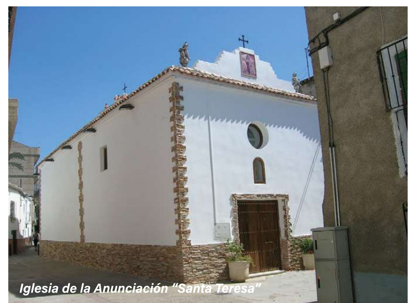
Iglesia de la Anunciación "Santa Teresa"