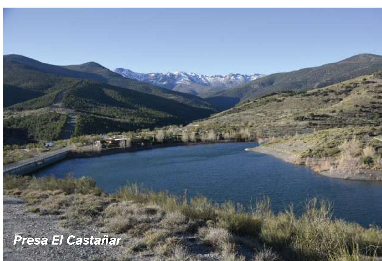
Presa El Castañar