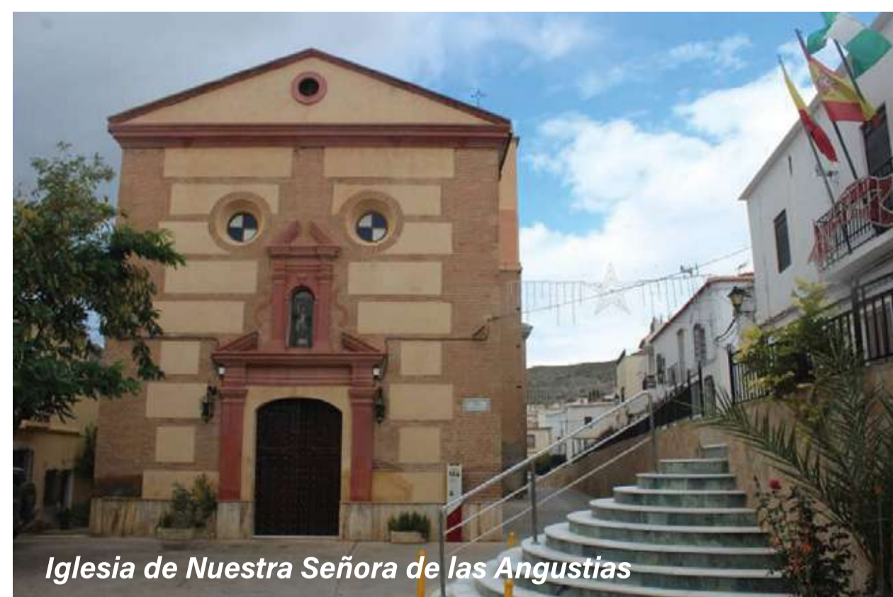
Iglesia de Nuestra Señora de las Angustias