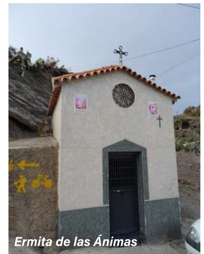
Ermita de las Ánimas