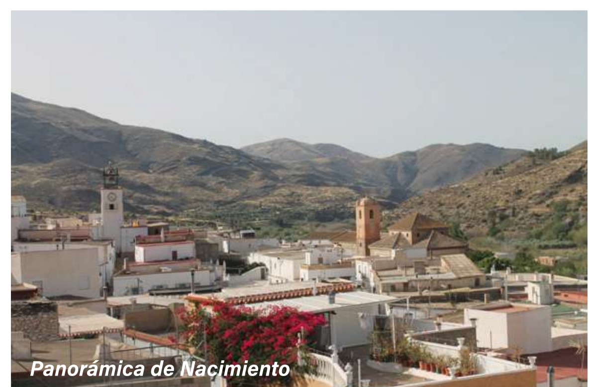
Panorámica de Nacimiento