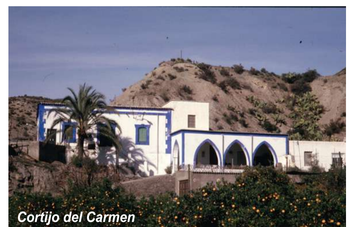
Cortijo del Carmen