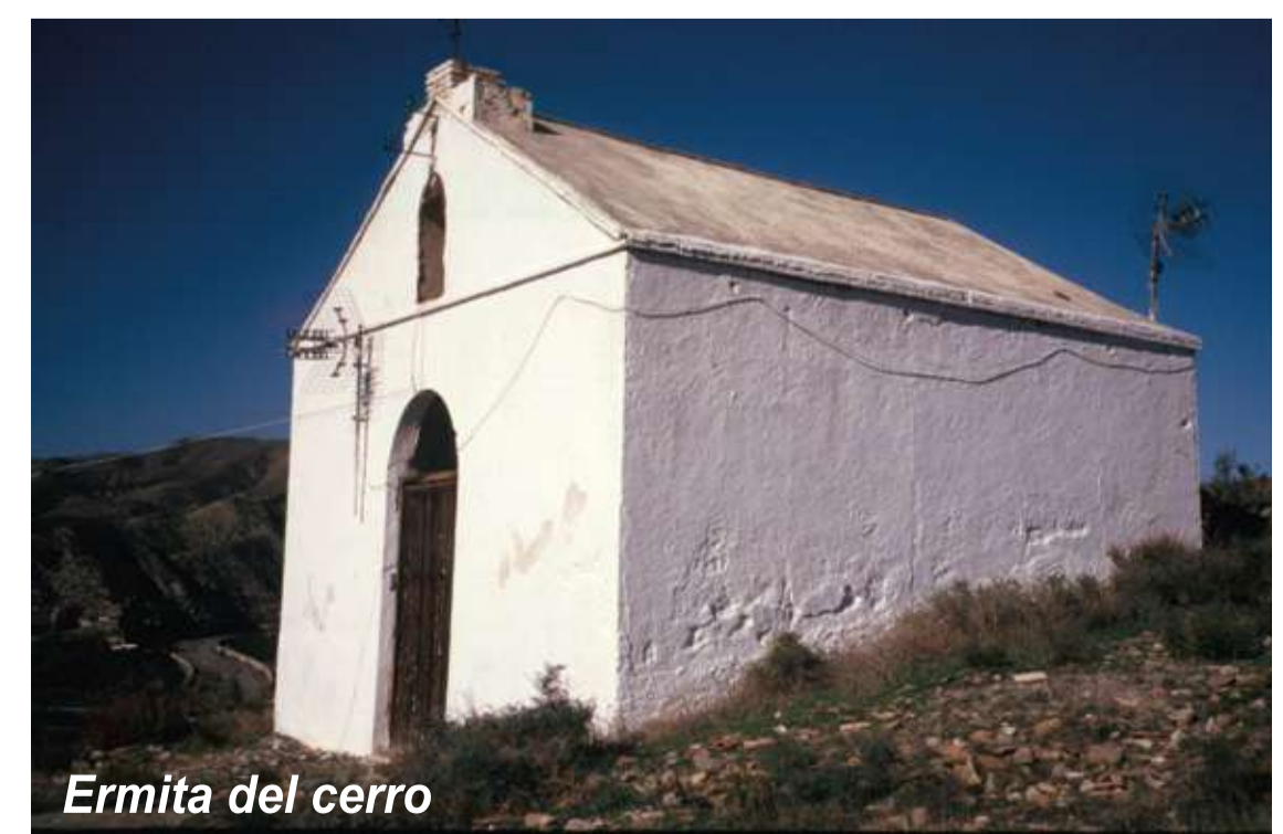
Ermita del cerro