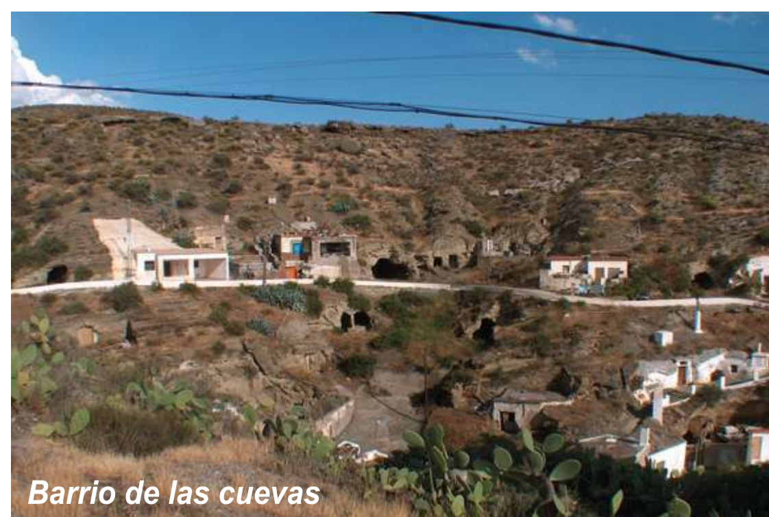
Barrio de las cuevas